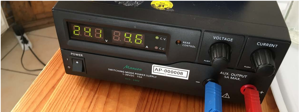
24,1 V DC und 4,6 A